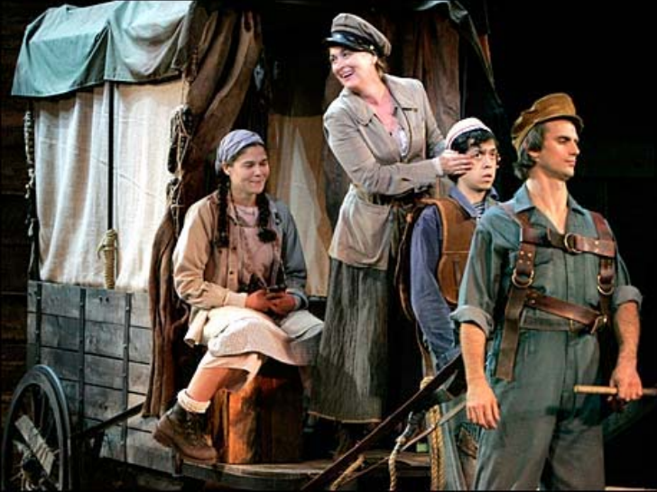
മദർ കറേജും അവളുടെ കുട്ടികളും

പേറും പെറുപ്പിനുമിടയിലും തളരാതെ, വീര്യം നശിക്കാതെ, തള്ളക്കോഴിയായ പിടക്കോഴിയായി സംരക്ഷണമന്ത്രം ഉരുവിട്ട്, കായായാലും മരമായാലും കുഞ്ഞായിക്കണ്ട് തലോടി, നിങ്ങൾ കരഞ്ഞുജനിച്ച സമയത്തുമാത്രം ചിരിച്ച, കണ്ണീരിലും പ്രാർത്ഥനയുടെ തീർത്ഥം തുകിയ, അമ്മമാരെ ഓർമ്മിപ്പിക്കുന്നു, ആ മദർ കറേജ് - എന്റേയും, നിങ്ങളുടേയും!